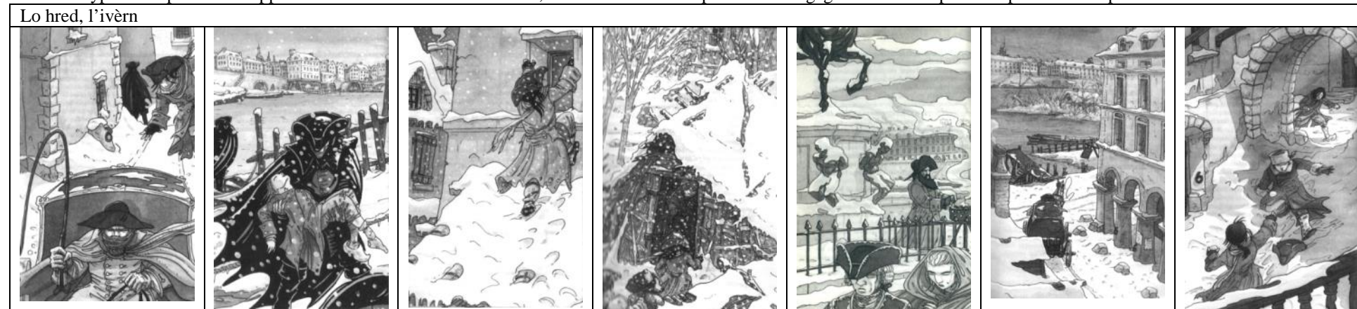
Illustration p15 par rapport au champ lexical de la nourriture, ou celles p 47 et p 98 par rapport au champ lexical de la bataille.

Textes de type descriptifs : Par rapport à certaines illustrations du livre, un travail d'écriture pourra être engagé en le reliant par exemple aux champs lexicaux :