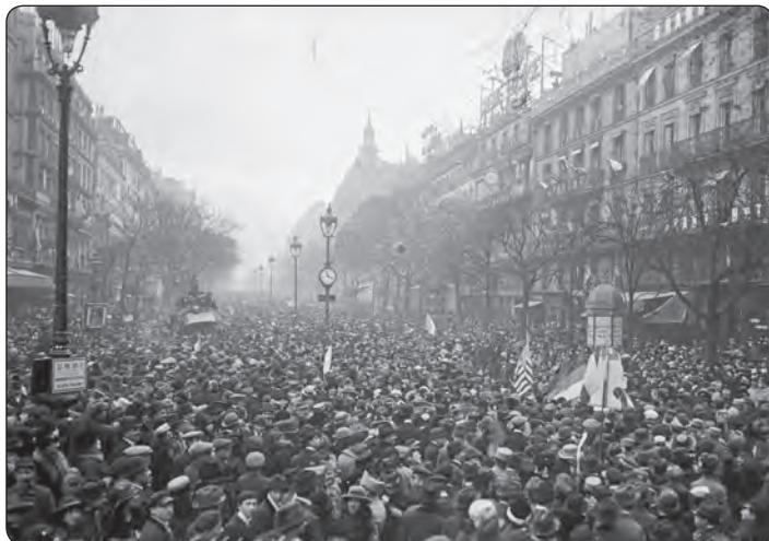
Los Grans baloards lo dia de l'armistici (la horrèra en gran gaujor au parat deu 11 de noveme de 1918) [fotografia de premsa] / [Agència Rol]